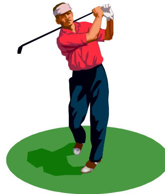
1. Netto Herren: Uwe Saddey